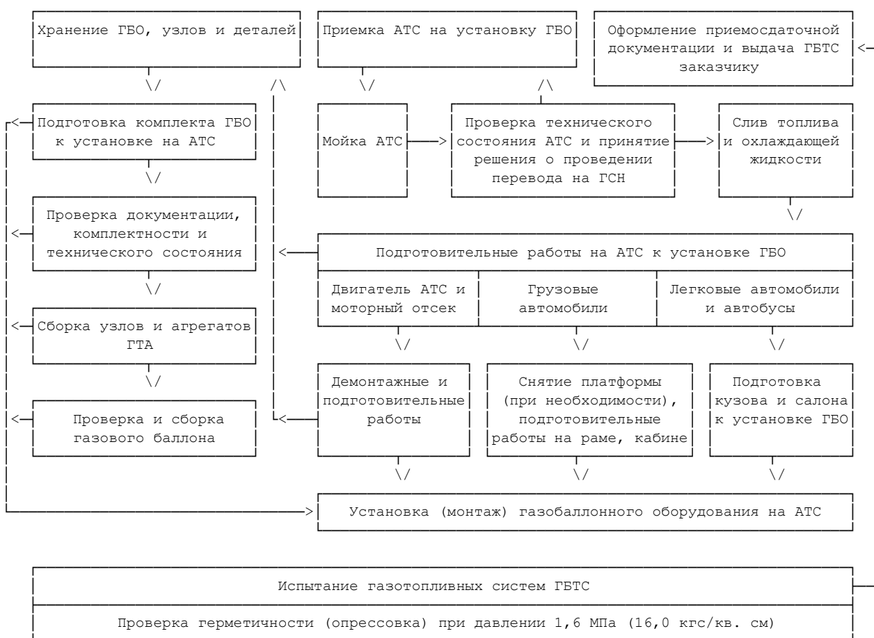
Рис. 2.1. Функциональная схема выполнения работ по переводу АТС для работы на ГСН и испытаниям газотопливных систем

2.1.12. Функциональная схема выполнения работ по переводу АТС для работы на ГСН и испытаний газотопливных систем приведена на рис. 2.1.